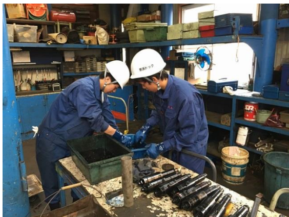
子安工場にて機関部品の洗浄作業を体験中